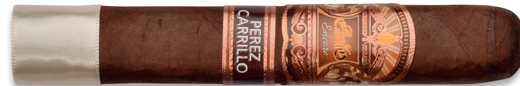
Celestial (Toro) | Artikelnr.: 1502797 | ♦ 136 mm | Ø 20,6 mm | VE: 10 Stück | 12,90 €/St.

Wer den roségoldenen Zigarrenring der »Encore« genauer betrachtet, wird feststellen, dass die »La Historia« einen ähnlichen trägt, nur die Farben unterscheiden sich. Wie der Name »Encore« bereits suggeriert, stellt sie die Zugabe zur »La Historia« dar. Die »Encore« sollte die Aficionados weltweit schon im Jahre 2016 begeistern, jedoch wollte Ernesto den Deckblättern noch ein wenig mehr Zeit geben. Er folgte seinem einmaligen Instinkt für Tabak und gab den Deckblättern noch ganze zwei Jahre mehr Zeit zum Reifen! Diese Entscheidung wurde vom »Cigar Aficionado« mit einem phänomenalen Rating von 96 Punkten belohnt!