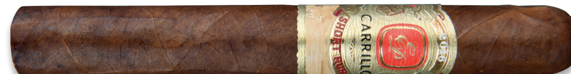
Short Run (Toro) | Artikelnr.: 1502822 | ♦ 152 mm | Ø 20,6 mm | VE: 10 Stück | 12,80 €/St.

Geschmack: Ein einzigartiger mittelkräftiger, komplexer Smoke mit Aromen von fruchtiger Süße, Pfeffer und Leder wechseln sich mit Noten von Nuss, Gewürzen und Milkschokolade ab.