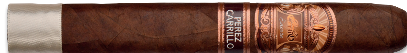
El Primero (Churchill) | Artikelnr.: 1502800 | ♦ 175 mm | Ø 21,4 mm | VE: 10 Stück | 13,80 €/St.

Jahrzehntelanges Wissen, kombiniert mit unzähligen Stunden der Sorgfalt und Aufmerksamkeit, haben die »Encore« geschaffen – ein einzigartiges Zigarrenerebnis! Also betauschen Sie sich an dieser herausragenden Zigarre und genießen Sie sie – vielleicht zusammen mit einem Latte Macchiato, so wie es Ernestos Tochter Lisette Perez Carrillo am liebsten tut! ■