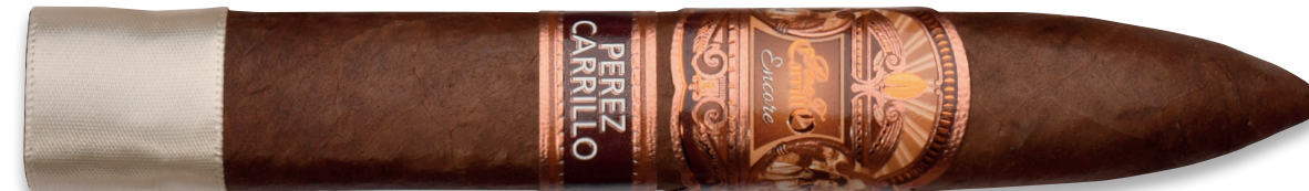
Valientes (Torpedo) | Artikelnr.: 1502798 | ♦ 155 mm | Ø 21,6 mm | VE: 10 Stück | 13,30 €/St.