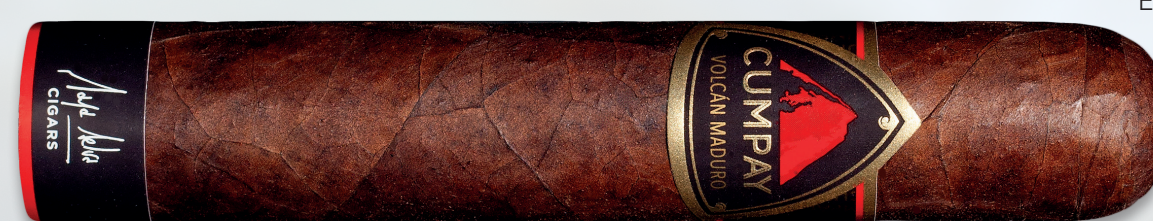
Volcán Maduro | Artikelnr.: 1502669 | ♦ 152 mm | Ø 23,8 mm | VE: 20 Stück | 9,50 €/St.

Es gibt nun viel zu entdecken: unter anderem finden wir Nuss- und Toffeeeromen. Alle Nuancen harmonieren perfekt miteinander! Die Pfefferwürze nimmt sich ein wenig zurück, bleibt eine Konstante und bringt den entscheidenden Kick, während wir mit Noten von Eukalyptus und Zeder ins letzte Drittel starten... ■