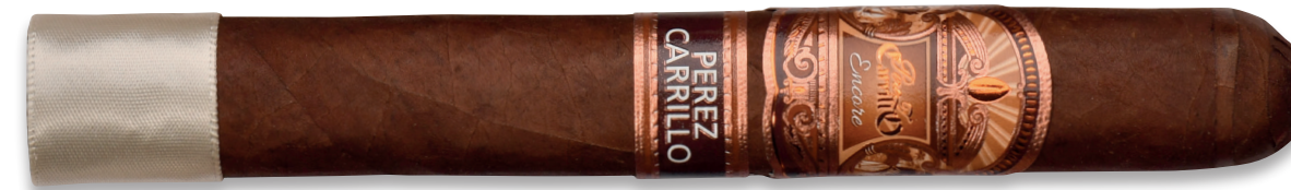
Majestic (Robusto) | Artikelnr.: 1502799 | ♦ 155 mm | Ø 20,6 mm | VE: 10 Stück | 12,60 €/St.