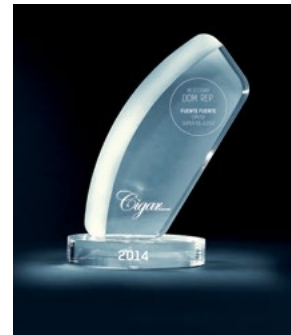
Best Cigar 2014, Dominikanische Republik Arturo Fuente OpusX Super Belicoso