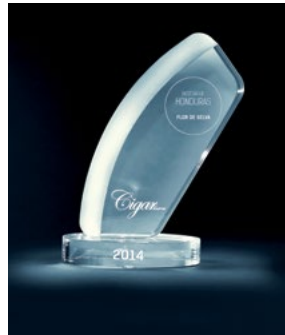
Best Value 2014, Honduras Flor de Selva