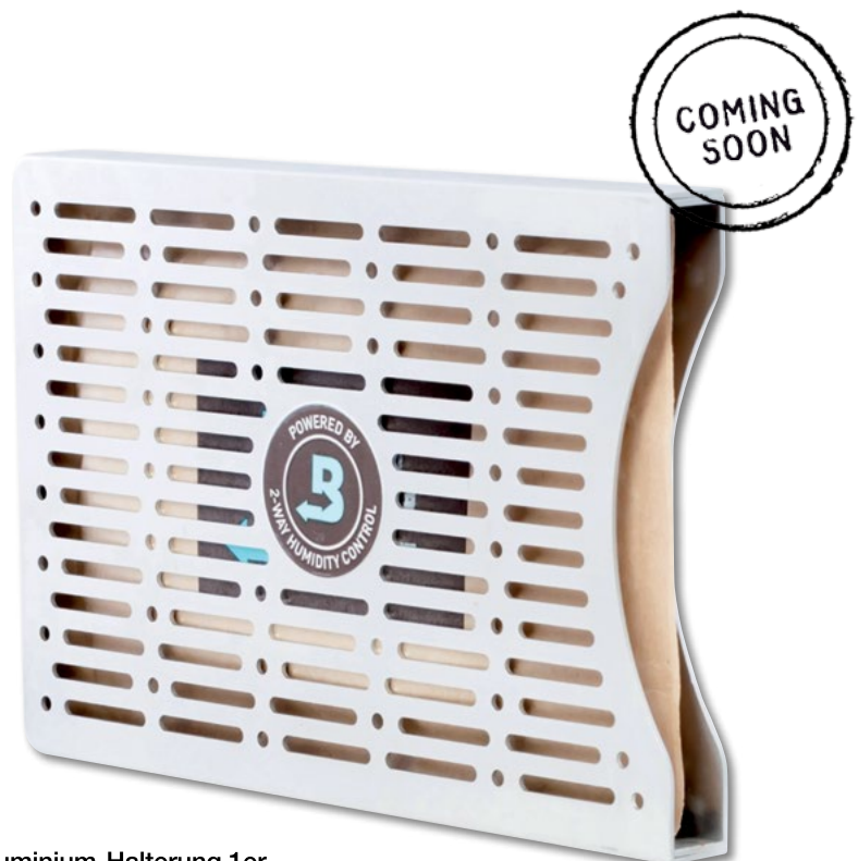
Boveda Aluminium-Halterung 1er

Die Boveda Packs werden nicht ausschließlich für die Tabak-Industrie verwendet, sondern können auch für die Frischhaltung von Lebensmitteln, für das richtige Feuchtigkeitslevel in Holzmusikinstrumentenkoffern sowie für die Beibehaltung der Farbintensität von Bildern verwendet werden. ■