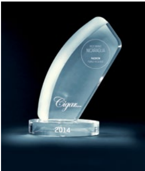
Best Brand 2014, Nicaragua Padrón Family Reserve

begehrte «Cigar Trophy» erhalten. Hierfür möchten wir uns bei allen, die für unsere Zigarren abgestimmt haben, herzlich bedanken. ■